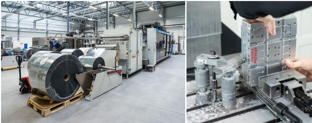
Na zdjęciu: Linia do termoformowania spółki KGL S.A.